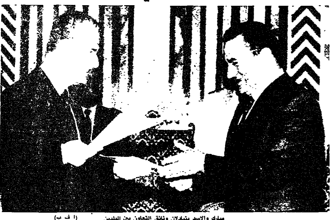
مبارك والاسد يتبادلان وتناق التعاون بين البلدين